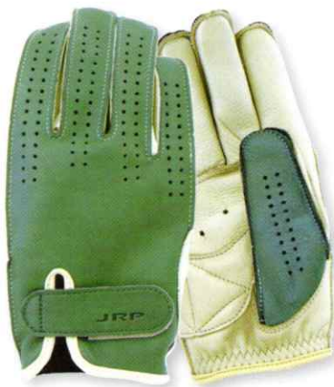
⑦グリーン/アイボリー