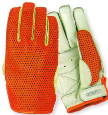
⑤オレンジ/アイボリー