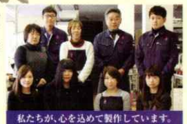
私たちが、心を込めて製作しています。

JRPは、1987年に生 香川県 まれました。 東かがわ市 それ以来オートバイを愛するライダー に、より快適なライディングを楽しん でもらおうと、一途にグローブを作り 続けて参りました。JRPのグローブ は、香川県 東かがわ市 の地で生産 されてお ります。