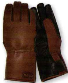
※今秋発売予定！ブラウン/ブラック

カフス部分を前モデルのGHWより、2cm延長したロングモデル。 手の甲面と親指外面の内側にネオプレン素材とフリース素材をラ ミネートしたインナーレス仕様。グローブ本体の素材皮革は環境に 配慮した皮革、エコレザー牛革を採用しました。