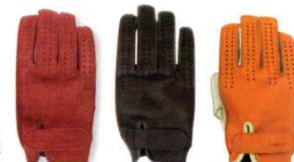
④ワイン ⑤ネイビー ⑥オレンジ/アイボリー