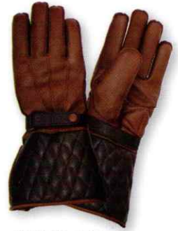
②ブラウン/ブラック

ガントレットタイプのウィンターグローブです。 手首部分からは耐水加工牛革を使い、カフス部分はオイル 入り牛革を使った、しっかりとしたロンググローブ。 カフス部分の内側には、ボア素材を使用しています。